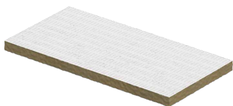
PANEL σελ. 340