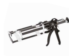
MAMMOTH DOUBLE σελ. 400